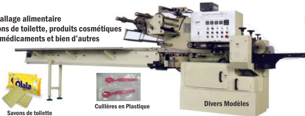
Savons de toilette

Emballage alimentaire Savons de toilette, produits cosmétiques Des médicaments et bien d'autres